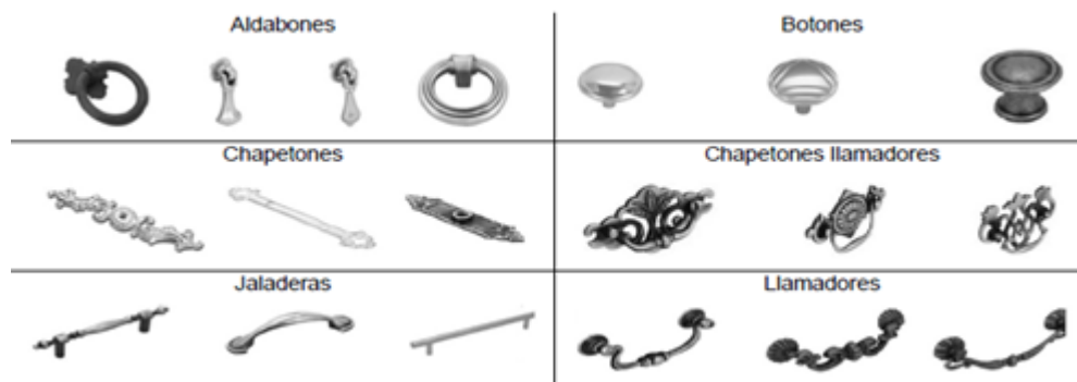
Ilustración 2. Jaladeras de zamac

9. Los tipos de jaladeras de zamac incluidos en la investigación son estrictamente jaladeras, botones, chapetones llamadores, llamadores, chapetones y aldabones, como los que se ejemplifican en la Ilustración 2.